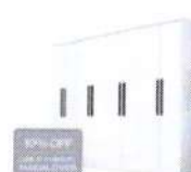
Guarda-roupa Casal 8 Portas 4 Gavetas Ar

de R$ 919,99 por R$ 549,90 4x de R$ 137,48 sem juros