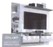
Pannel para TV até 55" 3 Prateleiras - L

de R$ 1.059,00 por R$ 759,91 à vista ou R$ 799,90 6x de R$ 133,32 sem juros