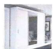
Guarda Roupá Casal com Espelho 3 Portas

de R$ 1.659,90 por R$ 1.349,90 10x de R$ 134,99 sem juros