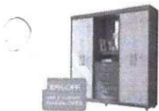
Guarda-roupa Casal com Espelho 4 Portas

de R$ 1.059,00 por R$ 759,91 à vista ou R$ 799,90 6x de R$ 133,32 sem juros