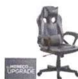
Cadeira Gamer Preta e Vermelha 100 - AC

de R$ 900,00 por R$ 799,99 6x de R$ 133,33 sem juros